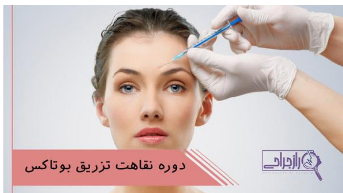
دوره نقاهت تزریق بوتاکس

بوتاکس و لیزر ، در گروه درمان هایی هستند که می توانند نتایج تاثیر گذاری را در پوست افرادی که از مشکلات چندگانه پوستی رنج می برند، بر جای گذاشته و جوانی را تا حد زیادی به آنها بازگردانند.